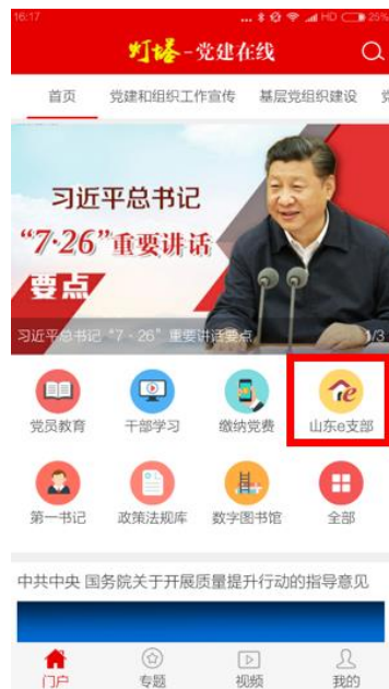
手机 APP 客户端